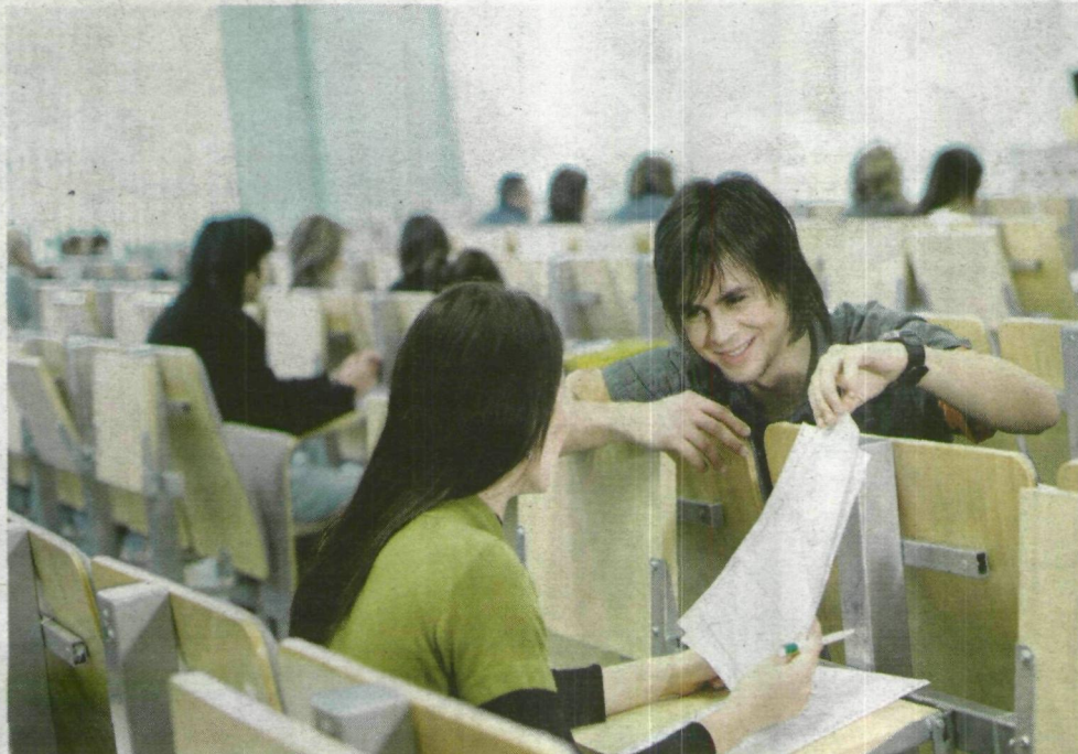
Podczas zajęć studenci zdobywają nie tylko praktyczne umiejętności, ale i wiedzę teoretyczną

Jednym z głównych wniosków płynących z prowadzonych badań jest brak specjali-